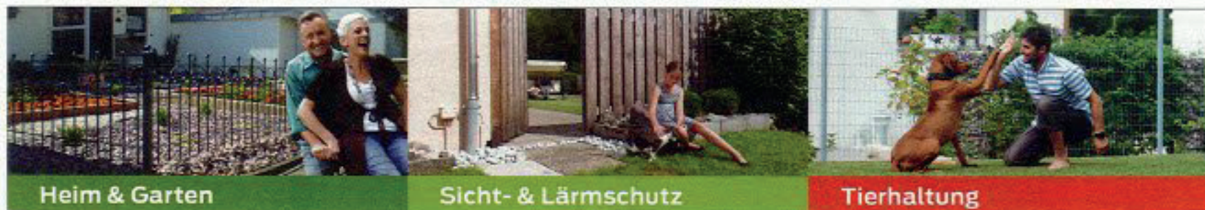
Heim & Garten

„Zaunteam“ ist mit dem Zaunteam Weser-Wümme (Oyten) in unserer Region bestens vertreten und bekannt für größte Auswahl, persönliche Beratung und fachgerechte Montage rund um Zäune und Tore für Heim und Garten, Sicht- und Lärmschutz, Industrie und Sicherheit sowie Landwirtschaft und Tierhaltung. Weitere Infos unter www.zaunteam.de . (hg)